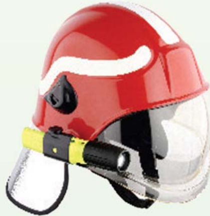
FIRE HT 04 Composite