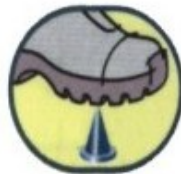
Chống đâm xuyên