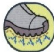
Chống tĩnh điện