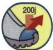
Chống va đập