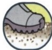
Chống trơn trượt