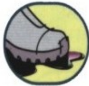
Chống dầu nhờn