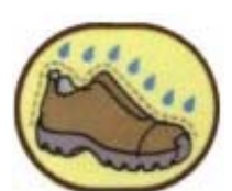
Chống thấm nước